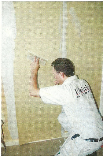
Den brunmurriga tapeten hängs på ett tjockt lager våtrumslim. Efter tapetsering skall radontapeten målas eller tapetseras över.