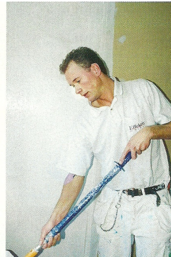
Noggrannheten är A och O.